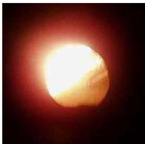
Горение мазута универсального

Мазуты универсальные возможно применять как топливо в стационарных котельных и ТЭЦ, в том числе и мини-котельных, в судовых теплоэнергетических установках отечественного и импортного производства, в качестве моторного топлива для малооборотных судовых и стационарных двигателей внутреннего сгорания и резервного топлива котельных и ТЭЦ, работающих на газе как основном виде топлива, а также как промышленное топливо для некоторых технологических печей (сушильные, парогенераторные и т.д.).